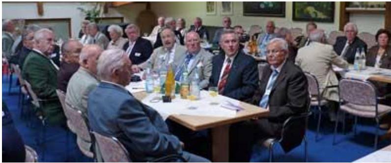
Blick in die Versammlung

Hinsichtlich weiterer politischer Perspektiven war man sich einig, dass derzeit die Grünen noch kein verlässlicher Partner für die CDU im Bund sind. Da müsse man sich deutlicher an die FDP halten. Der derzeitige Tiefstand der SPD bei den Meinungsumfragen mit ihrem schwachen Vorsitzenden Kurt Beck an der Spitze ist für die CDU kein Grund zur Freude; denn dadurch wird eher die Linke gestärkt, womit wiederum die Gefahr verbunden ist, das politische System der parlamentarischen Demokratie zu destabilisieren.