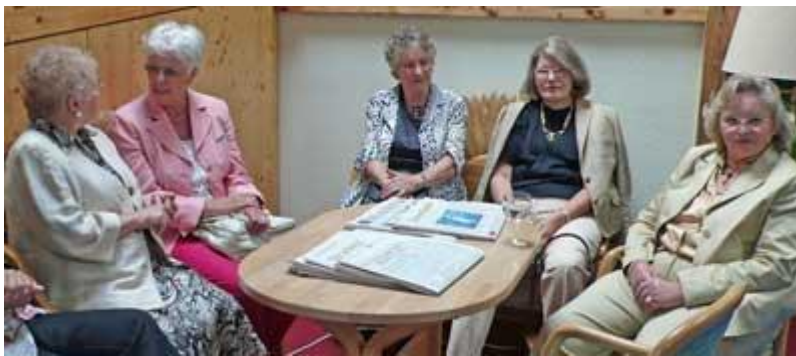
auch an das Partner(innen)programm war gedacht